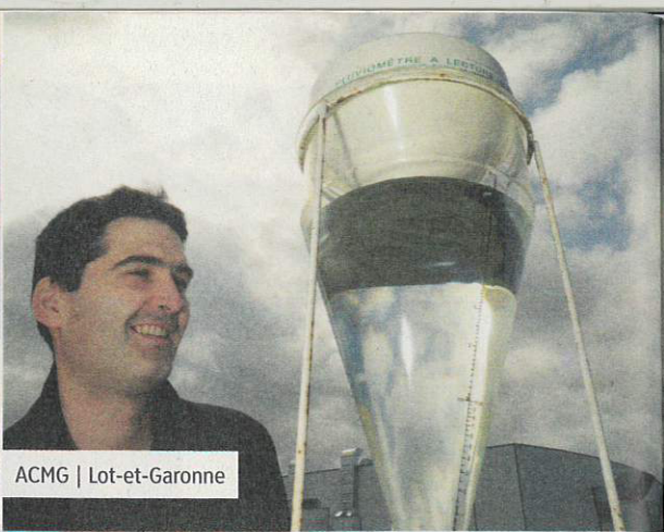
ACMG | Lot-et-Garonne