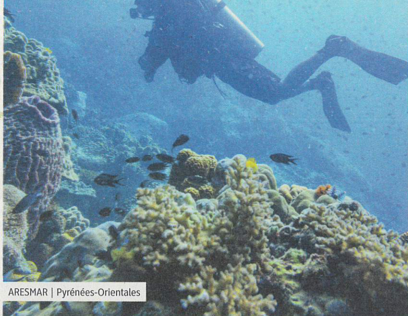
ARESMAR | Pyrénées-Orientales