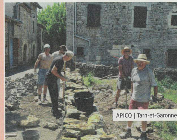
APICQ | Tarn-et-Garonne