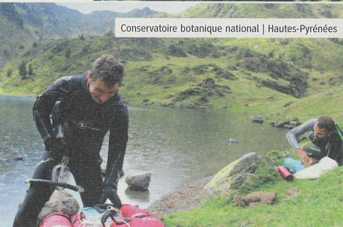
Conservatoire botanique national | Hautes-Pyrénées