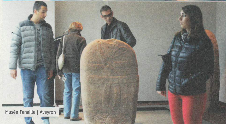
Musée Fenaille | Aveyron