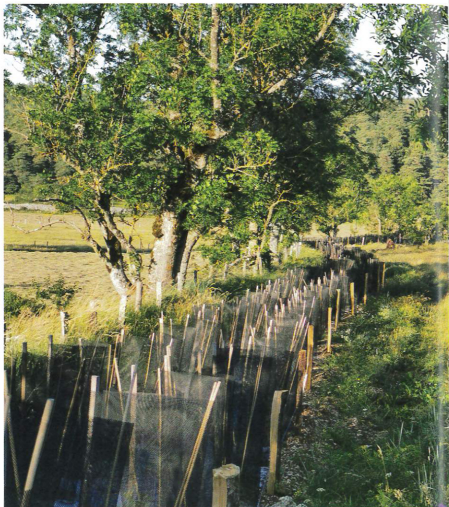
Haie fraîchement plantée, avec amélanchier des bois, cornouiller mâle, églantine, noisetier, ronce, aubépine et quelques tilleuls, charmes, merisiers...

Pour schématiser, il existe trois grandes familles de haies : - Les haies libres sont le modèle de nos haies anciennes, elles bordent plutôt les prés et les champs, jusqu'à l'abond des villages. Constituées d'un mélange de divers arbres de haute tige (parfois de variétés anciennes) ou d'arbustes buissonnants, de ronces et d'aubépines, elles ne sont taillées que si elles gênent les cultures ou pour contenir le bétail (alternance culture/pâturage). Les grands arbres de ces haies, souvent taillés en têtards, assuraient bois de chauffe et fourrage pour les bêtes. Les ronces, églantines, sureaux et autres noisetiers permettaient la cueillette nourricière des hommes (mûres, cynorhodons, sureaux...) et des animaux, qui y trouvent, outre la nourriture, protection et lieu propice à la reproduction. Ces haies qui servaient de bornage aux terres agricoles se retrouvaient aussi le long des chemins ruraux, dits « creux » parce qu'on y récoltait la terre de surface, fumée par les troupeaux de passage, pour enrichir les potagers. - La haie brise-vent constituée d'arbres naturellement verticaux ou dont on accentue la pousse verticale par la taille. Sa hauteur, de 3 à 15 mètres, est un compromis entre plusieurs facteurs, vent,