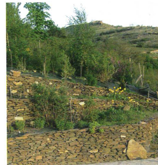
Haies, 2 ans après la plantation... et 20 ans après.

On évitera les résineux qui poussent vite et apportent trop d'ombre au sol.