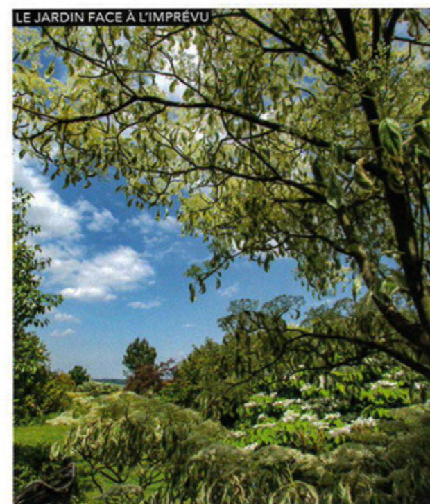
LE JARDIN FACE À L'IMPRÉVU

Hausse constante des moyennes de température, épisodes violents, sécheresse... la météo guide les évolutions de nos jardins.